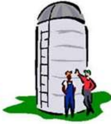
Οικοδομική αδειοδότηση και επιβολή